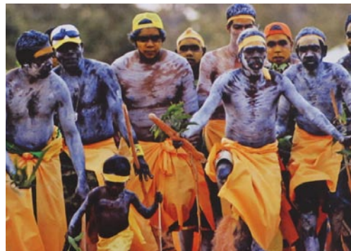
Voilà les Aborigènes en tenue traditionnelle, ils dansent sur la musique du didjeridoo.

Nous avons au retour découvert des animaux un peu particuliers :