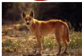
DINGO , mais qui est aussi une sorte de chien qui vit en Australie : le dingo