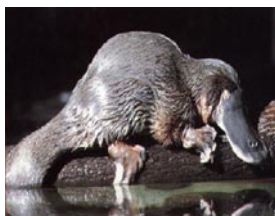
L'ornithorynque : c'est un mammifère avec un bec de canard, une queue de castor et des pattes palmées ! Quel mélange !