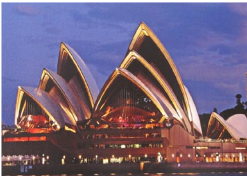
Ce bâtiment, un peu bizarre : c'est l'opéra de Sidney.