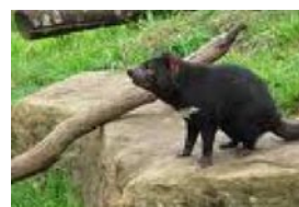
TAZ qui existe vraiment mais qui n'a pas tout à fait la même apparence ... et qui s'appelle Le diable de Tasmanie

Nous avons passé une bonne journée, et si on faisait un voyage en Australie, après Paris ?